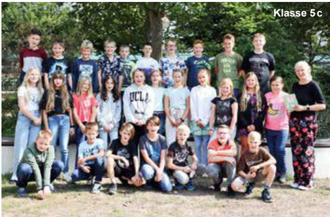
Klasse 5 c