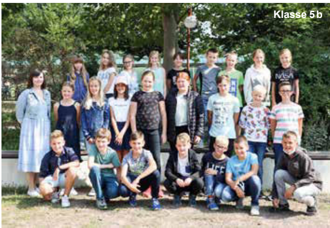
Klasse 5 b