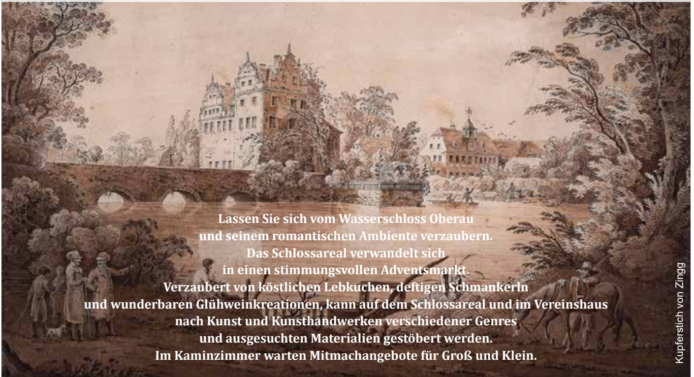
Kupferstich von Zingg

Lassen Sie sich vom Wasserschloss Oberau und seinem romantischen Ambiente verzaubern. Das Schlossareal verwandelt sich in einen stimmungsvollen Adventsmarkt. Verzaubert von köstlichen Lebkuchen, deftigen Schmankerln und wunderbaren Glühweinkreationen, kann auf dem Schlossareal und im Vereinshaus nach Kunst und Kunsthandwerken verschiedener Genres und ausgesuchten Materialien gestöbert werden. Im Kaminzimmer warten Mitmachangebote für Groß und Klein.