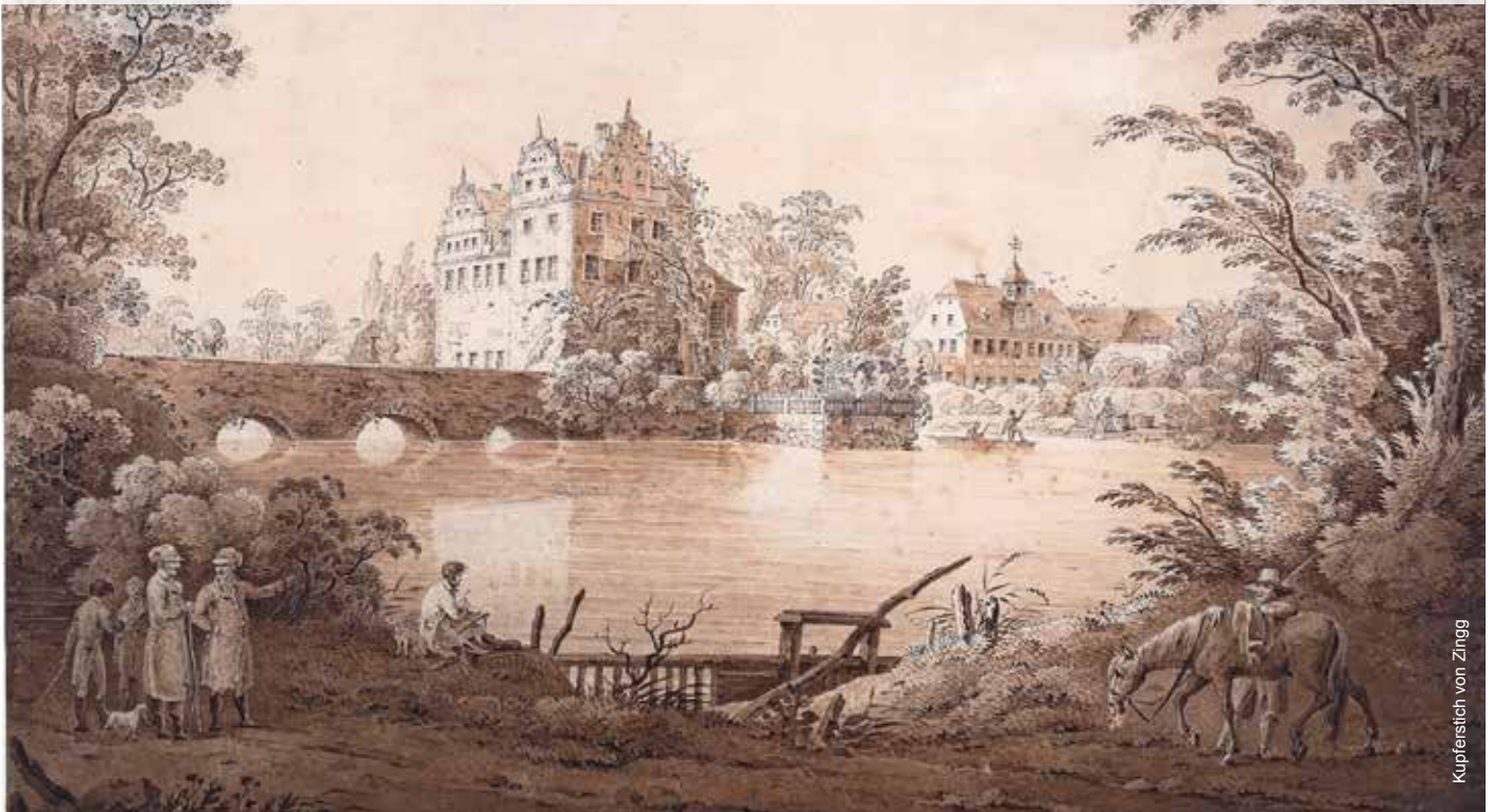
Kupferstich von Zingg