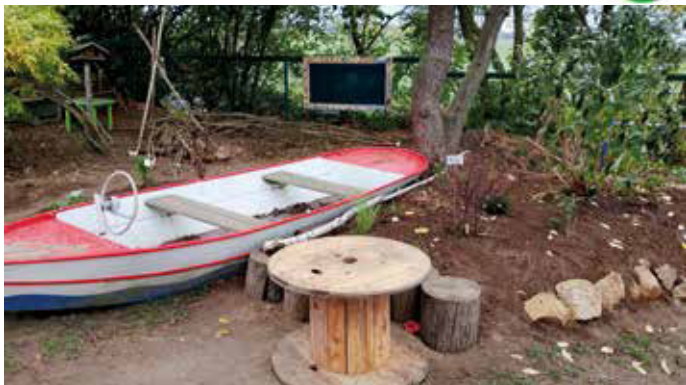
„Jeder Garten ist eine kleine Welt voller Wunder.“ Unbekannter Verfasser