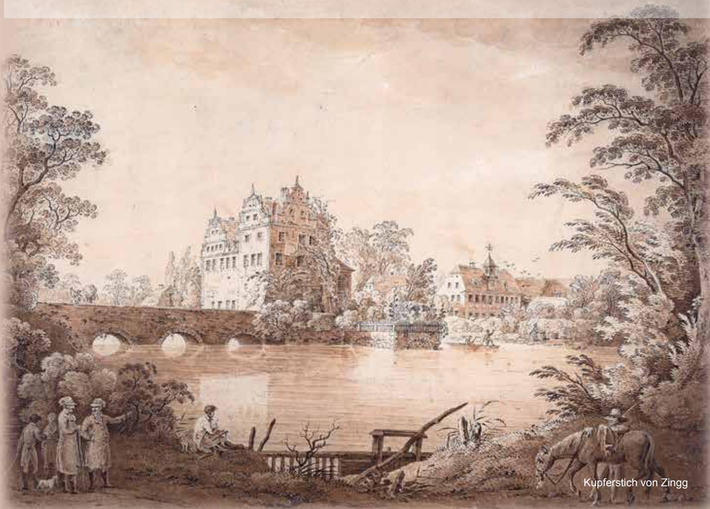
Kupferstich von Zingg

Oberauer Schlossweihnacht am ersten Adventswochenende 29./30.11.2025 | Sa 14 – 21 Uhr | So 12 – 18 Uhr in historischem Ambiente am Wasserschloss Oberau