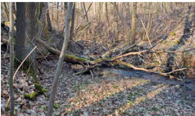
Foto: Flussholz ist ein wertvoller Lebensraum und darf in der freien Landschaft im Gewässer bleiben.

Dieser Text entstand in Zusammenarbeit der Fachberaterinnen und Fachberater Gewässer des Landesamtes für Umwelt, Landwirtschaft und Geologie und der unteren Wasserbehörde des Landkreises.